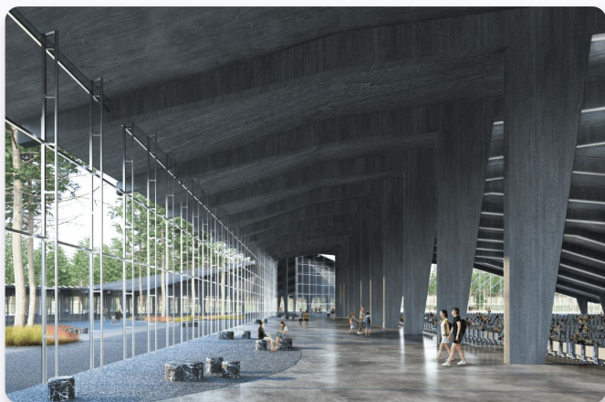
Международный фестиваль университетского спорта (Екатеринбург, Свердловская область)

Ежегодно проводим более 100 развлекательных и деловых мероприятий, концертов