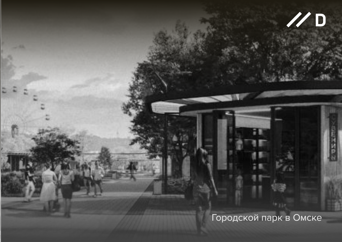
Городской парк в Омске