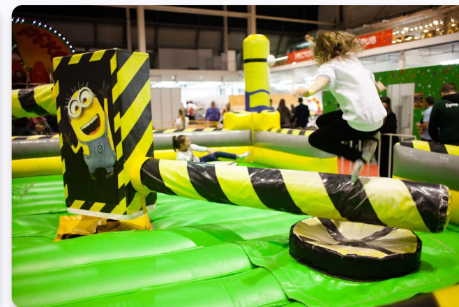
Новогодний тематический семейный парк развлечений ЭкспоЕлка (Свердловская область)